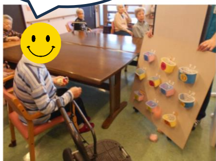
お手玉バスケット